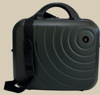
VERDE MILITAR 8007440019